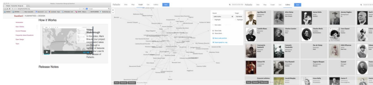
Map, Graph and Gallery views

10h15-11h00 : Le projet Mapping the Republic of Letters : Palladio un nouvel outil proposé au chercheur pour explorer ses données , par Giorgio Caviglia, Lead design researcher, Stanford University, http://palladio.designhumanities.org/ .